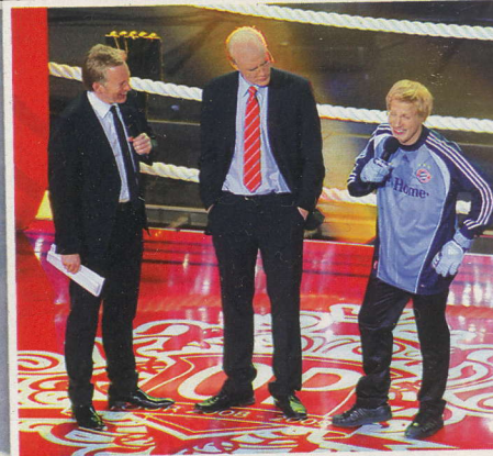
Spaßterrorist Als Olli Kahn verkleidet (Foto oben, rechts), lieferte Pocher eine gelungene Persiflage ab. Das gefiel auch seiner Freundin Monica Ivancan (unten)